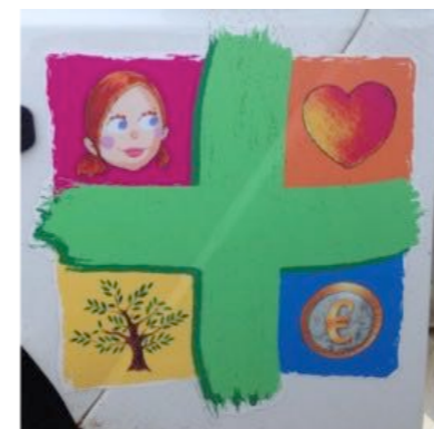
Pharmacie Lagrave Hourtin